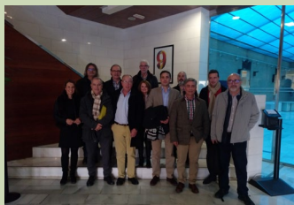
Imagen de la alianza colegial captada el 23 de enero de 2019