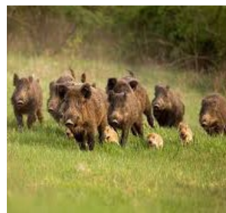
Una práctica que se prohibió en 2022 y que con ella se pretende atraerlos a los

Una de las medidas que introduce es la recuperación del cebado para el jabalí entre los meses de marzo y agosto.