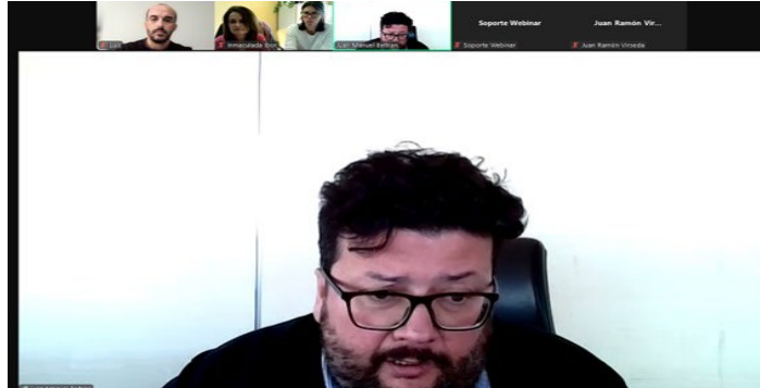
El director general de Salud Pública, Juan Manuel Beltrán, durante la inauguración on line del curso el pasado 13 de enero.

Beltrán se dirigió aquel 13 de enero a los alumnos en esa primera jornada y coincidió con la presidenta del ICOV, Inmaculada Ibor -también presente en la inauguración- en la defensa de una for-