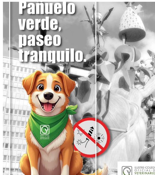
Imagen de la Campaña de Fallas 2025

Para difundir tal mensaje y esas recomendaciones se diseñó para las Fallas pasadas una campaña con cartelería y pósters, que este año se ha complementado con el mensaje del pañuelo verde. Desde el 4 de marzo, esta acción se puede ver en los