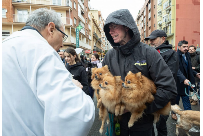
Sobre estas líneas, una simpática imagen de la bendición de animales. Abajo, a la izqda., los perros rescatadores homenajeados