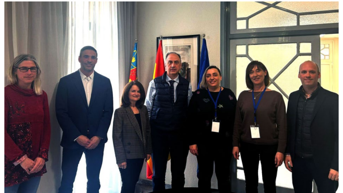
Imagen del encuentro de los responsables del CVCV con el conseller de Emergencias e Interior, Juan Carlos Valderrama (en el centro, con chaleco).

El objeto del citado plan sería establecer las actuaciones protocolizadas