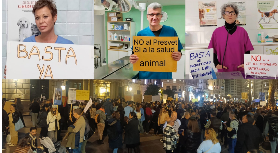
Arriba, tres imágenes captadas durante el cierre simbólico de centros veterinarios realizado en la Comunitat y en buena parte del resto del país. Sobre estas líneas, manifestación en Valencia al final de su recorrido, en el Ayto.

Efectivamente, haciéndose eco de todo lo ya reclamado formalmente antes desde el propio CVCV, se pasó a exigir una moratoria en la notificación de las prescripciones antimicrobianas y una modificación del RD 666/2023 que recoge tal obligación para no "limitar el criterio profesional del veterinario"; se reclamó la