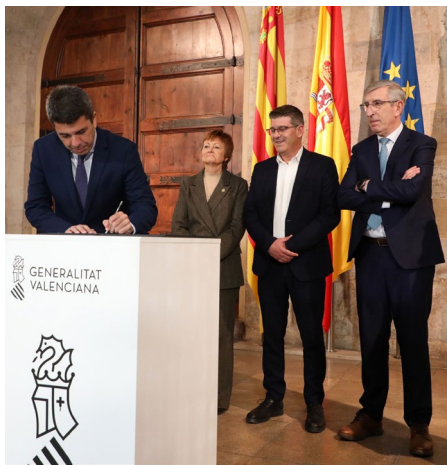
Carlos Mazón firmando en el Palau el protocolo de intenciones para el proyecto de Ontinyent

Un dato resulta revelador sobre la inoportunidad del plan: ese medio millar de plazas para Veterinaria, más las 150 de las dos facultades existentes en Murcia suponen igualar en número de centros (5) y casi la misma cantidad de plazas que las existentes en toda Francia (650 por las 724 del país galo).