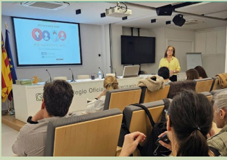
Imagen del curso del 20 de febrero sobre uso de antimicrobianos en ICOVV